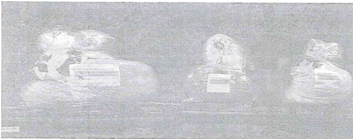
Mercancía con la que se realizó la comparación.

http://www.bodegapacasderopa.net/tienda/params/category/0/item/594190/ Mercancía embargada ubicada en el Recinto Fiscal.