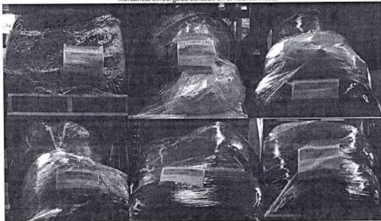
Mercancía embargada ubicada en el Recinto Fiscal.

Ahora bien, respecto del inventario del Acta de Inicio de Procedimiento Administrativo en Materia Aduanera, que contiene el Caso Uno y Caso Dos, descritas como: Ropa usada y Calzado usado , se procede a realizar la comparación de la mercancía embargada, con la diversa mercancía consultada en tiendas virtuales, tomando en consideración que aunque no sean iguales en todo, pero tengan características semejantes, les permite cumplir las mismas funciones y ser comercialmente intercambiables, por lo anterior, se consideraron aspectos relevantes como son: descripción de la mercancía, calidad, utilidad y/o función para el que fueron diseñados, mismo al que se puede acceder con la siguiente liga de la página principal a la que se puede acceder: http://www.bodegapacasderopa.net/ . Derivado de lo anterior, se procede a consultar las mercancías comercializadas en las tiendas virtuales antes señaladas, así como el valor a que se comercializan a efecto de recabar los precios de referencia en que se basó la obtención de la Base Gravable del Impuesto General de Importación, anexando las imágenes que corresponde a la página.