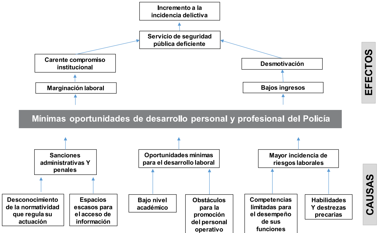
Figura No. 1 Árbol de Problemas